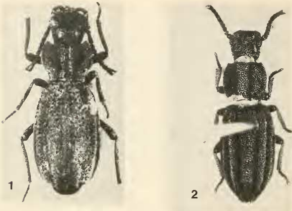
Abb. 1. Adelostomoides grandis (H.-R.), Ht ♂